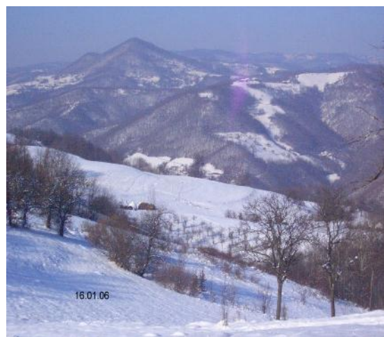
Слика 11. Зимска идила