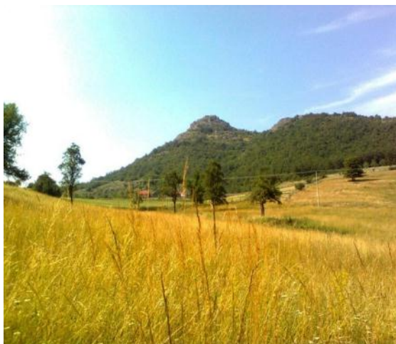
Слика 8. Пејзаж са погледом на Туларски вис (942м)

одражава на могућности продаје сопствене производње сеоског домаћинства туристима (млеко, јаја, месо, сир, поврће, воће, љута ракија од старих сорти воћа, чист планински мед, кајмак...) Тиме се обезбеђују додатни приходи сеоских домаћинстава ових планинских крајева.