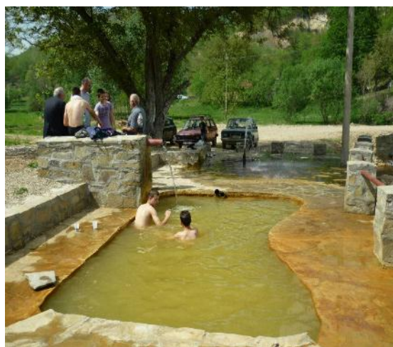
Слика 3. Данашњи изглед извора Слане воде (Гејзир)