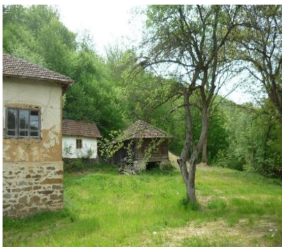
Слика 6. Изглед домаћинства

Сам куриозитет овог подручја лежи у томе што су већина кућа и објеката грађене крајем 19 и почетком 20 века када је и започето насељавање овог краја. Већина тих објеката су и дан данас у изворном и традиционалном облику са наменом за становање или неком другом наменом за коју су предвиђени.