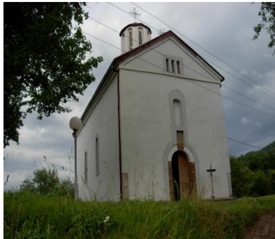
Слика 15. Црква Св. Троице у Тулару