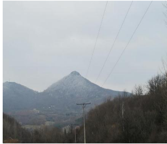
Слика 4. Каптиран извор Киселе воде Слика 5. Мркоњски вис (1014 м)