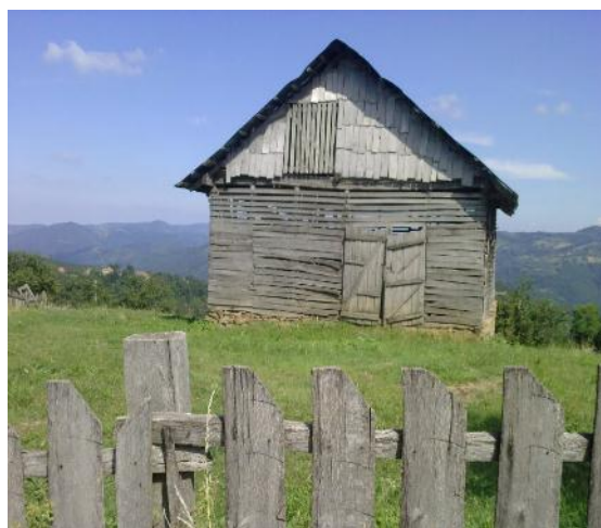
Слика 7. Изглед помоћног објекта (плевна)

Пролазећи овим крајем приметио сам постојање великог броја планинских потока који малим уређењем могу довести до праве оазе мира и места за одмор и уживање. Исто тако да се приметити постојање великог броја воденица које су изграђене у 19 в.