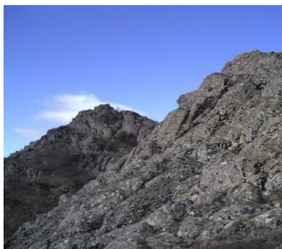
Слика 13. Мркоњски вис