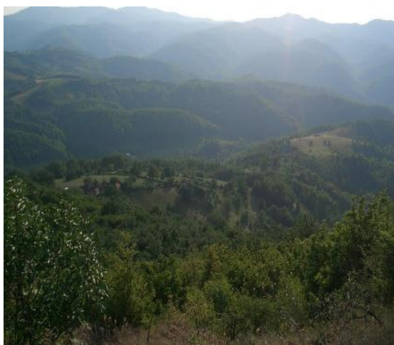
Слика 10. Поглед са Мркоњског виси