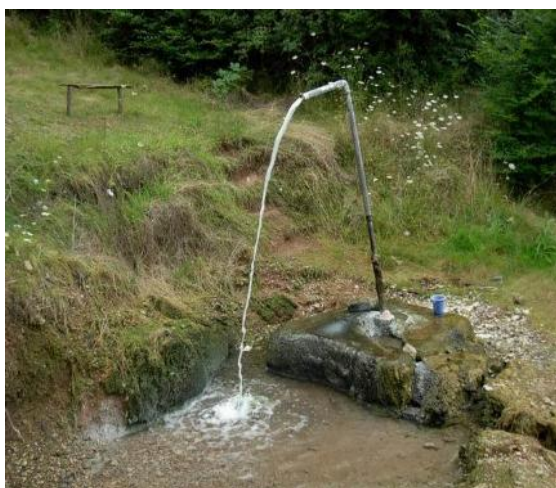
Слика 2. Некадашњи извор Слане воде (Гејзир)

Најјачи извор друге групе термалних извора је слани извор. Назив „СЛАНИ ИЗВОР“ датира још из 1893. год када је први пут ова вода анализирана и том анализом утврђен велики проценат натријума, угљен диоксида, сумпора, гвожђа, па је стога ова вода још од тад важила за јако лековиту воду. Каснијим истраживањима је тачно утврђен хемијски састав ове воде и потврђена чињеница лековитог својства. Ови извори се користе код функционалних гастроинтестиналних обољења, код поремећаја метаболизма и код анемичних стања. Извор је спроведен као Гејзир и ту су направљена два мала базена. Вода са овог извора се може користити за пиће а такође се може и купати у базену.