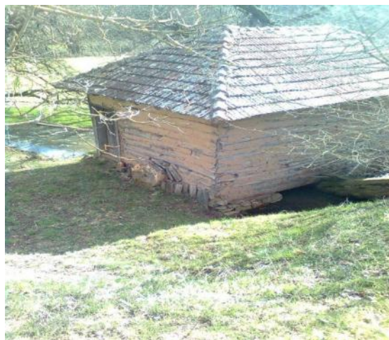
Слика 9. Стара воденица у Тулару