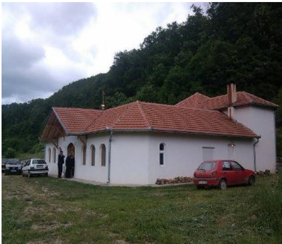
Слика 14. Манастир Пресвете