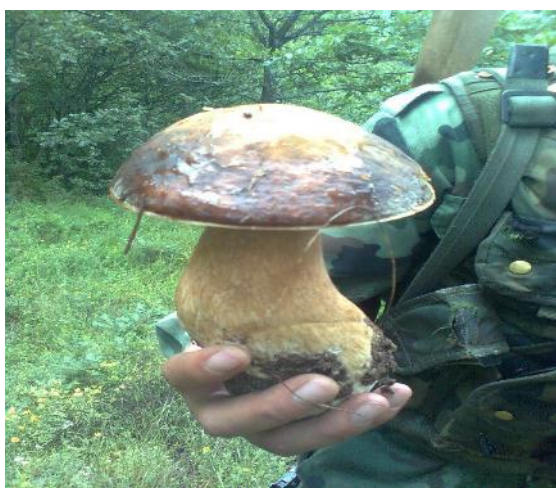
Слика 12. Вргањ из храстове шуме